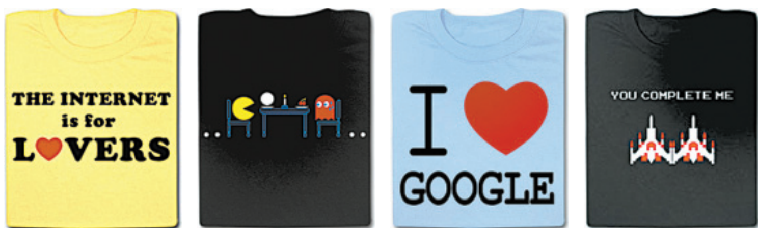
Camisetas do site norte-americano Nerdy Shirts; redes sociais, jogos e marcas como Google viram estampas bem-humoradas